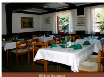
Blick ins Restaurant