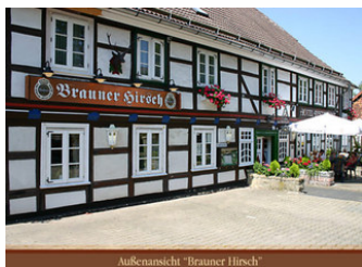
Außenansicht "Brauner Hirsch"